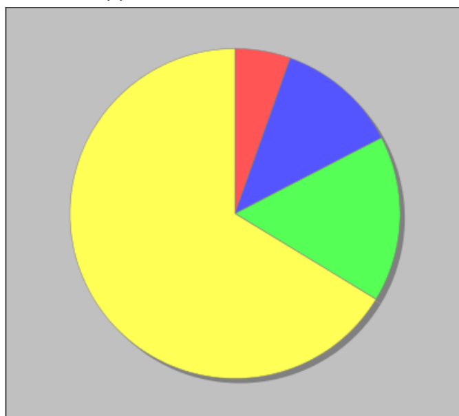
Distribuzione dei docenti a T.I. per anzianità nel ruolo di appartenenza (riferita all'ultimo ruolo)